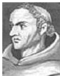
Guillermo de Ockham (1285-1347)