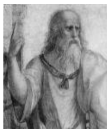
Platón (427-347 a.C.)